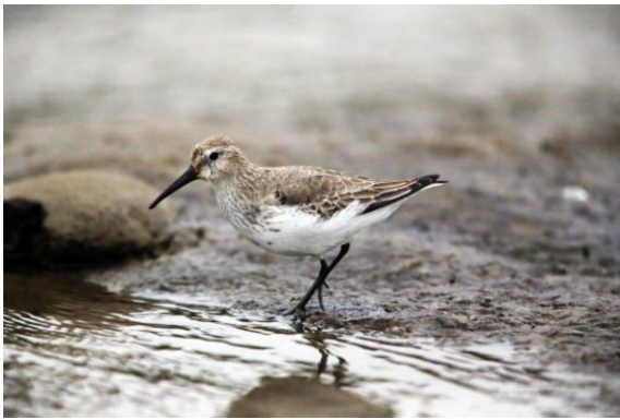
图1 黑腹滨鹬

2016年11月和12月在汉江安康段进行水鸟调查时,记录到黑腹滨鹬( Calidris alpina )、角鸬鹚( Podiceps auritus )和斑脸海番鸭( Melanitta fusca ),均为陕西省鸟类新纪录。