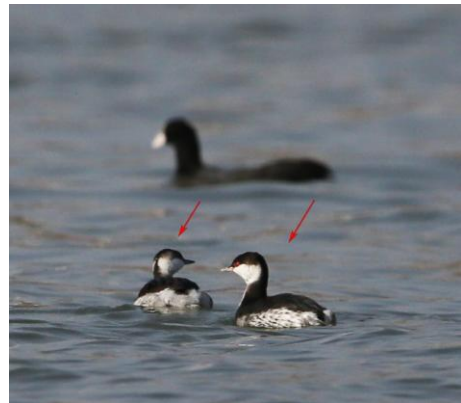
图2 角鸬鹚

2016年11月24日在安康市汉滨区汉江四桥以西的沙滩处(32°42'37"N, 109°02'05"E)发现一只滨鹬(图1)。拍照后用单筒望远镜(Zeiss 85T* FL 20-60X)观察,其主要特征为:嘴长而略弯,黑色,眉纹白色,颈侧和胸具褐色细纵纹,腹白色有零星黑斑,头顶、后颈、背、肩和翅上覆羽淡灰褐色,翅上覆羽具白色羽缘;中央尾羽黑褐色,两侧尾羽灰色有明显白色羽缘。经查阅相关文献,认定该物种为黑腹滨鹬(约翰·马敬能等 2000, 赵正阶 2001),并确认其为陕西省鸟类新纪录(冯宁 2008, 郑光美 2011)。黑腹滨鹬隶属于鸬鹚目(Charadriiformes)鸬鹚科(Scolopacidae)滨鹬属,目前认为有10个亚种(van Gils et al. 2017),其中