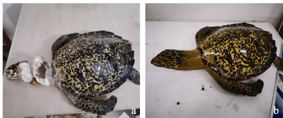
图 1 干裂破损海龟标本修复前 (a) 和修复后 (b)

面对剥制标本出现干裂与破损，根据不同种类剥制标本，因破口不同而采取不同的修复技术。拟修复的海龟 ( Chelonia mydas ) 标本 (图 1a) 破损处是头颈部，这也是海龟标本常见的破损部位。破损原因是头颈部皮肤干裂或霉烂导致整个头部和颈部填充的棉花等内容物爆出 (剌海阔等 2009)，使头颈部皮肤完全破损。修复技术方案：首先把海龟标本头颈部原来填充的棉花等内容物取出，然后用聚氨酯发泡填充头部和颈部，待发泡完成后，用锉刀修出弯度和大小适宜的颈部。最后用塑钢土塑出海龟头顶部和颈部皮肤褶皱，待塑钢土固化后，即可调配颜料完成补色，并在外面喷一层树脂漆保色 (图 1b)。