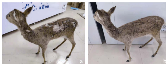
图 2 河鹿标本毛发修复前 (a) 和修复后 (b)

接着使镊子上的毛发根部粘上白乳胶，顺着毛根粘贴在缺毛处并及时整形，白乳胶干后便无法整形。因所修复毛发部位与原河鹿毛发存在色差，故需要通过补色使其颜色协调一致 (图 2b)。