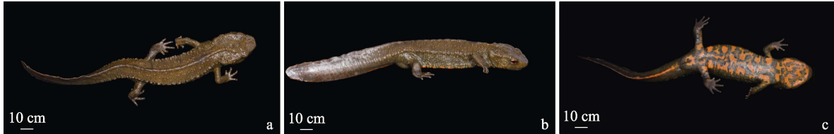
图 1 德氏瘰螈 (SWFU 18983, ♀)

具初步调查,当地居民没有利用德氏瘰螈的传统,该物种也尚无规模化的商业贸易,其主要威胁来自于栖息地破坏。采集地溪流的下游地区存在香蕉种植田,蕉地扩大和农药使用