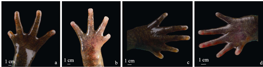
图 2 德氏瘰螈手与足形态 (SWFU 18983, ♀)

a. 背面; b. 侧面; c. 腹面。a. Dorsal view; b. Lateral view; c. Ventral view.