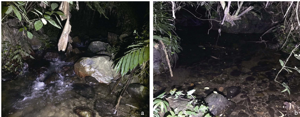
图 4 德氏瘰螈栖息地环境