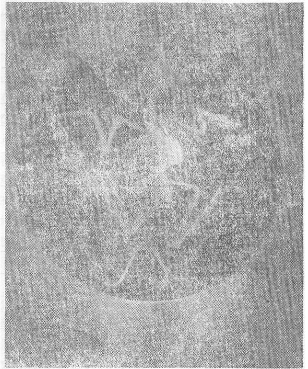
图2 畸形麻雀骨骼的侧面观

一部分长15毫米, 后一部分的末端向两侧稍有扩伸, 每一侧均以关节相联有一“畸形胫腓骨”, 长均为12毫米, 而“畸形跗跖骨”小而不明显, 每一“畸形跗跖骨”从关节相联有二个“畸形