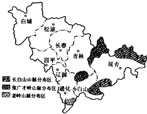
图1 吉林省野生黑熊分布示意图

龙、靖宇、抚松的有林山地。这个区域有林地面积很大,仅浑江市就有经营林地面积约 14 000 km 2 。在这样大的面积中,仅有小部分林型保留或恢复较好,人为干扰较少,适合黑熊栖居,且呈分割岛状分布。本区有适合黑熊栖息的面积 3 500 km 2 ,分布密度约 0.087 只/km 2 。