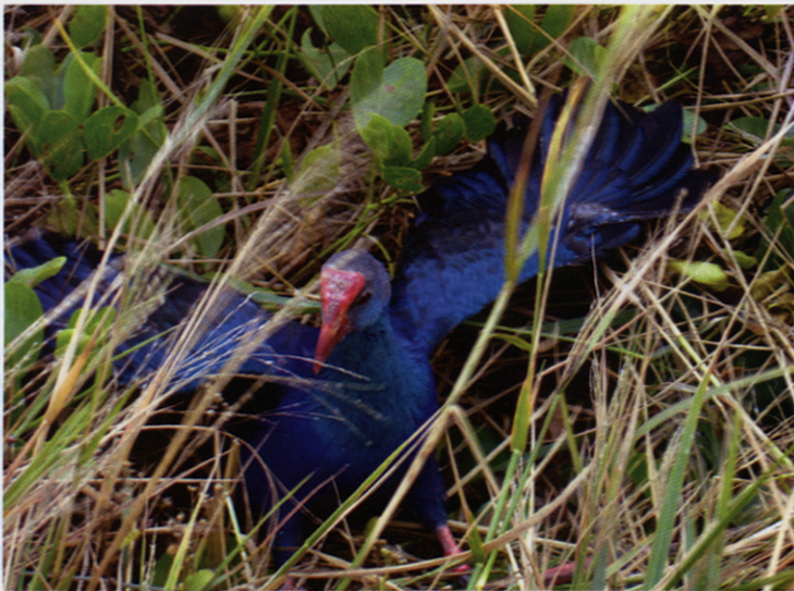
图 2 紫水鸡

大湖和东关联安围湿地面积约 65 km 2 ,但适合紫水鸡生存的环境大概为 20 km 2 。研究所选取的范围是紫水鸡分布相对集中、种群密度较高的区域。水葱、芦苇等适合紫水鸡生存的植被分布较广。如果按照 13.33 只/km 2 估算,