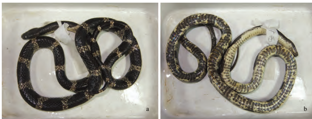
图 1 广西猫儿山福清链蛇 (HB-LF-20110401)

安县猫儿山国家级自然保护区采集到蛇类雌性成体标本 1 号 (标本号: HB-LF-20110401, 表 1, 图 1)。2011 年 5 月, 在浙江缙云县新建镇河阳村采集到蛇类雌性成体标本 1 号 (标本号: HB-LF-20110502, 表 1, 图 2)。2012 年 4 月, 在江西省赣州市全南县采集到蛇类雄性成体标本 1 号 (标本号: HB-LFjx-201264, 表 1, 图 3)。经鉴定这 3 号标本为福清链蛇 ( Lycodon futsingensis ), 为广西壮族自治区、浙江省和江西省三省首次记录发现。2013 年 9 月, 在广东省惠州市博罗县罗浮山南楼寺的后山溪沟采集到福清链蛇成体雌、雄标本各 1 号 (采集号: HB-LFbl-2013092401, HB-LFbl-2013092402, 表 1, 图 4), 为该种类在广东省的新分布点。