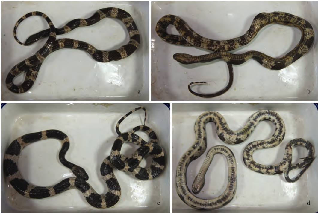
图 4 广东罗浮山福清链蛇 Fig. 4 Adult Lycodon futsingensis found at Luofushan, Guangdong a, b. HB-LFbl-2013092401 (♀) 背面、腹面; c, d. HB-LFbl-2013092402 (♂) 背面、腹面。 a, b. HB-LFbl-2013092401 (♀) dorsal, ventral; c, d. HB-LFbl-2013092402 (♂) dorsal, ventral.