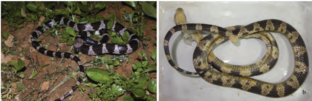
图 3 江西全南县福清链蛇 (HB-LFjx-201264) Fig. 3 Adult male Lycodon futsingensis (HB-LFjx-201264) found at Quannan, Jiangxi a. 背面; b. 腹面。a. Dorsal; b. Ventral.