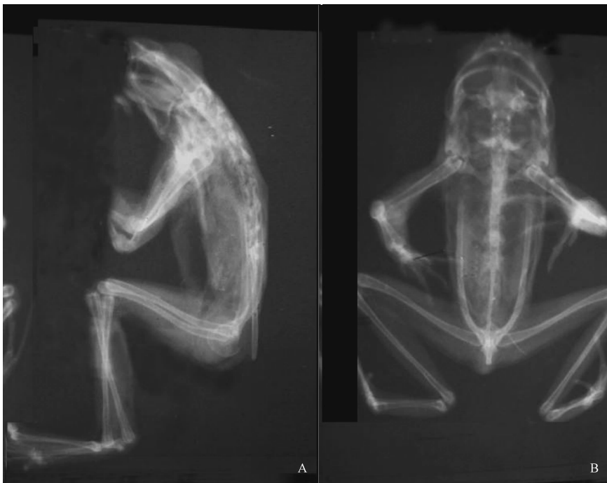
图 1 尾突角蟾的 X 光透视照片

雌蟾背面皮肤不光滑,还有许多长、短疣粒连成行排列,有连眼列、两眼后到背中列列以及