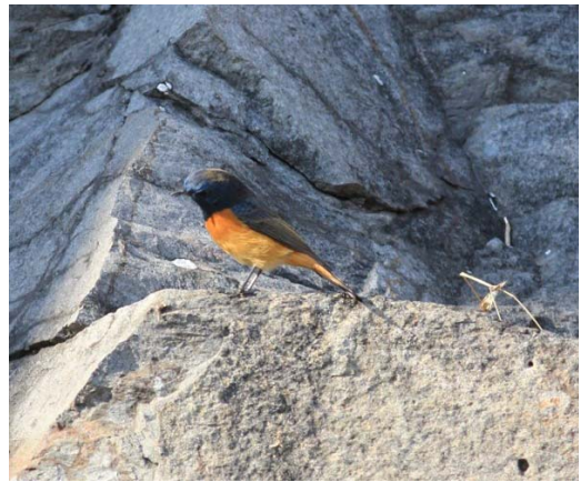
图 1 江苏句容赤山的蓝额红尾鹟雄性亚成鸟

孙风菲等 (2017) 通过检索观鸟数据库提及在江苏赤山的记录, 未见照片证据, 前述 2017 年 2 月 11 日的记录为该种在江苏境内的首次确切影像记录。同时, 通过检索全国鸟类多样性观测网络数据库 (徐海根等 2018)、网络数据库 (中国观鸟记录中心 2022, eBird 2022, Avibase 2022)、《上海鸟类名录 2020》(上海野鸟会 2021) 以及咨询相关的观鸟爱好者, 发现该物种 2021 年 11 和 12 月在北京昌平区有 4 笔记录 (中国观鸟记录中心 2022); 2016 年 2 月在江苏连云港有 3 笔记录, 2017 年 2 月在镇