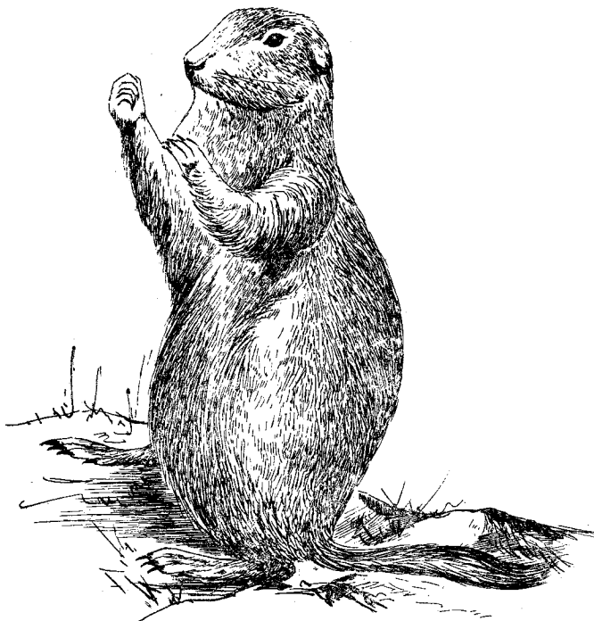
图 4 高山旱獭 ( Marmota bobacina )

的场所,鸟类也不得不在地上或洞穴中营巢。在我们的考察区内,完全是一片高山草原,没有树木或灌丛。