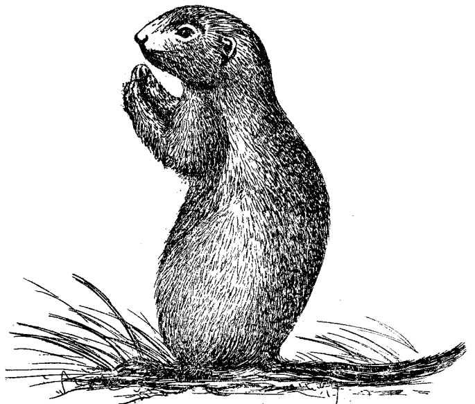
图 3 长尾黃鼠 ( Citellus undulatus )