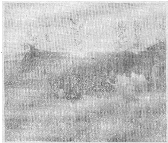
图2 北京黑白花奶牛(♀)