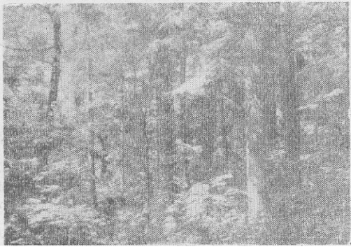
图 1 原始混交林

长白山自然保护区,是我国最大、建立得最早的综合性自然保护区之一。位于吉林省东南部靠近长白山主峰的中上部。地跨安图、抚松、长白三县。该处山高而自然条件复杂,垂直地带性极为明显,具有典型的山地垂直自然景观特征,可明显的分为三个垂直自然景观带: