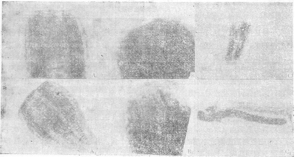
图2 真涡虫再生状况比较(使前端切口的变化)

A, A 1 , 截断后半小时100×, B, 截断后第4天, B 1 , 截断后第7天, 创伤面完全愈合 100×(以上均为显微照相), C, 截断后第13天, 再生成完整躯体1:1.7, C 1 , 截断后第13天, 未再生成完整躯体1:6.6。(A, B, C 为试验组, A 1 , B 1 , C 1 为对照组)