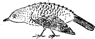
图 2 虎斑地鸫攻击姿态

鸣声 惊叫时声如“ga——”, 响亮而粗涩。或发如吹哨样的“hyo——”长音。啾鸣时声如“hi—hyo—”尖锐的高音。夜间亦鸣叫。