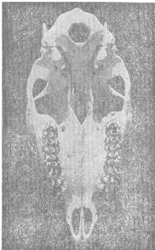
图1 有犬齿的上颌骨