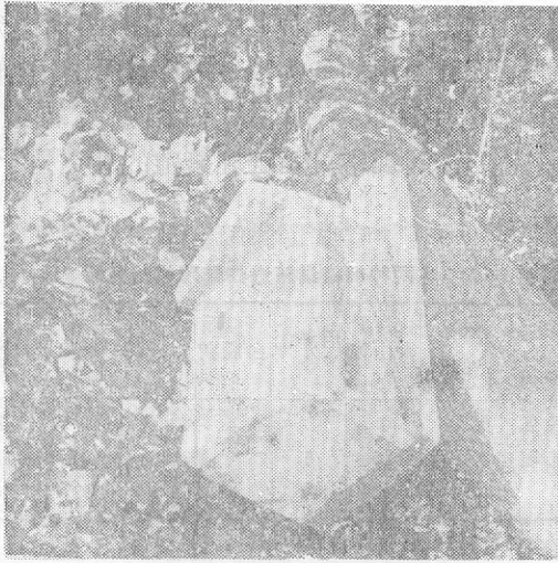
图2 山雀式人工巢箱